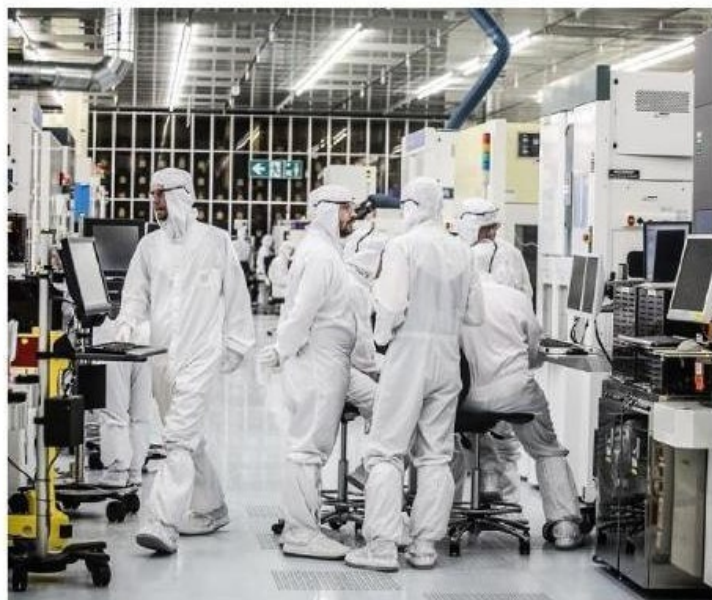
Slechts 5,9 procent van de werknemers in Limburgse bedrijven beschikt over een universitair diploma.