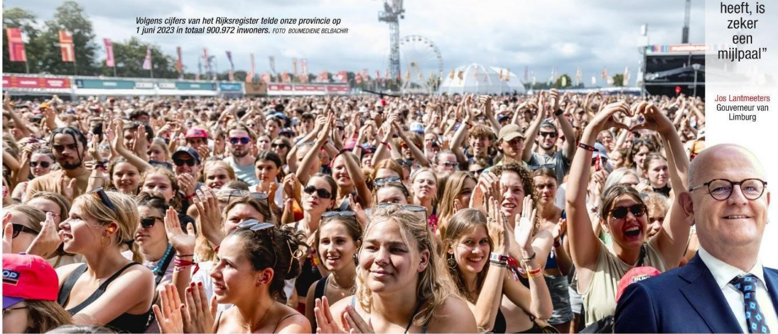
Volgens cijfers van het Rijksregister telde onze provincie op 1 juni 2023 in totaal 900.972 inwoners.