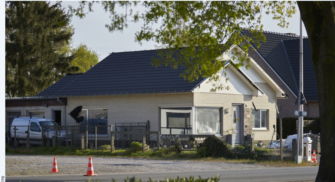
De cannabisplantage met liefst 2.173 planten bevond zich in de loods achter de woning in Zonhoven.

In een Ford Ranger daagde de eigenaar van de loods, de 34-jarige F.B., op. Hij was in het gezelschap van spilfiguur S.F. Rond 3.30 uur werden meerdere schoten gelost. Niemand raakte gewond. In hun zwarte pick-up zetten F.B. en S.F. de achtervolging in op twee Albanese in een Fiat Bravo. Op de Weg naar Zwartberg ging de Fiat aan de rotonde meerdere keren over de kop. Volgens het parket doordat de Ford de Fiat