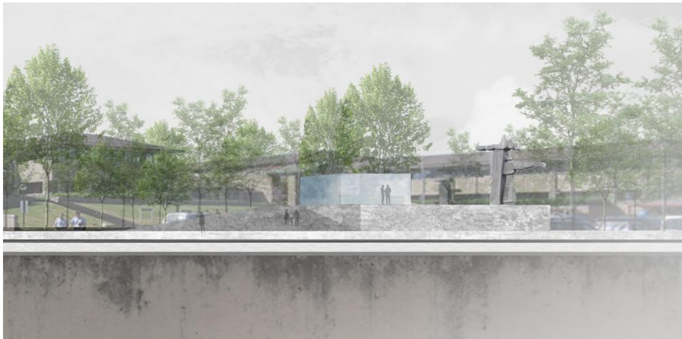
De toegangszone van het provinciehuis aan de Universiteitslaan wordt heraangelegd.

De toegangszone krijgt een nieuwe trappenpartij en een hellingbaan. Op het eerste niveau komt er een multifunctioneel ontvangstplein. Op gelijke hoogte met de Spartacushalte komt er een extra fietsparking voor de werknemers van het provinciehuis met plaats voor 310 fietsen en 30 laadpunten voor elektrische fietsen. Op termijn moet deze fietsparking uitgroeien tot een fietshub waar je vlot kan overschakelen van de fiets op het openbaar vervoer of de auto en andersom.