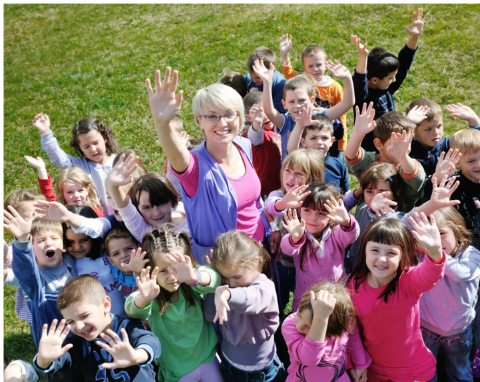
Een Hart voor Limburg doet nu een projectoproep om ervoor te zorgen dat er door de coronacrisis nergens kinderen uit de boot dreigen te vallen.