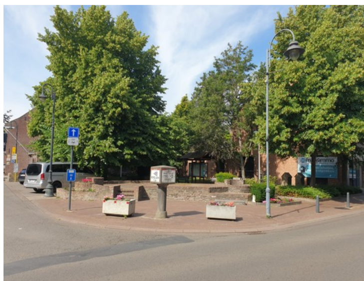
Op het Schoverikplein komt er meer ruimte voor groen.