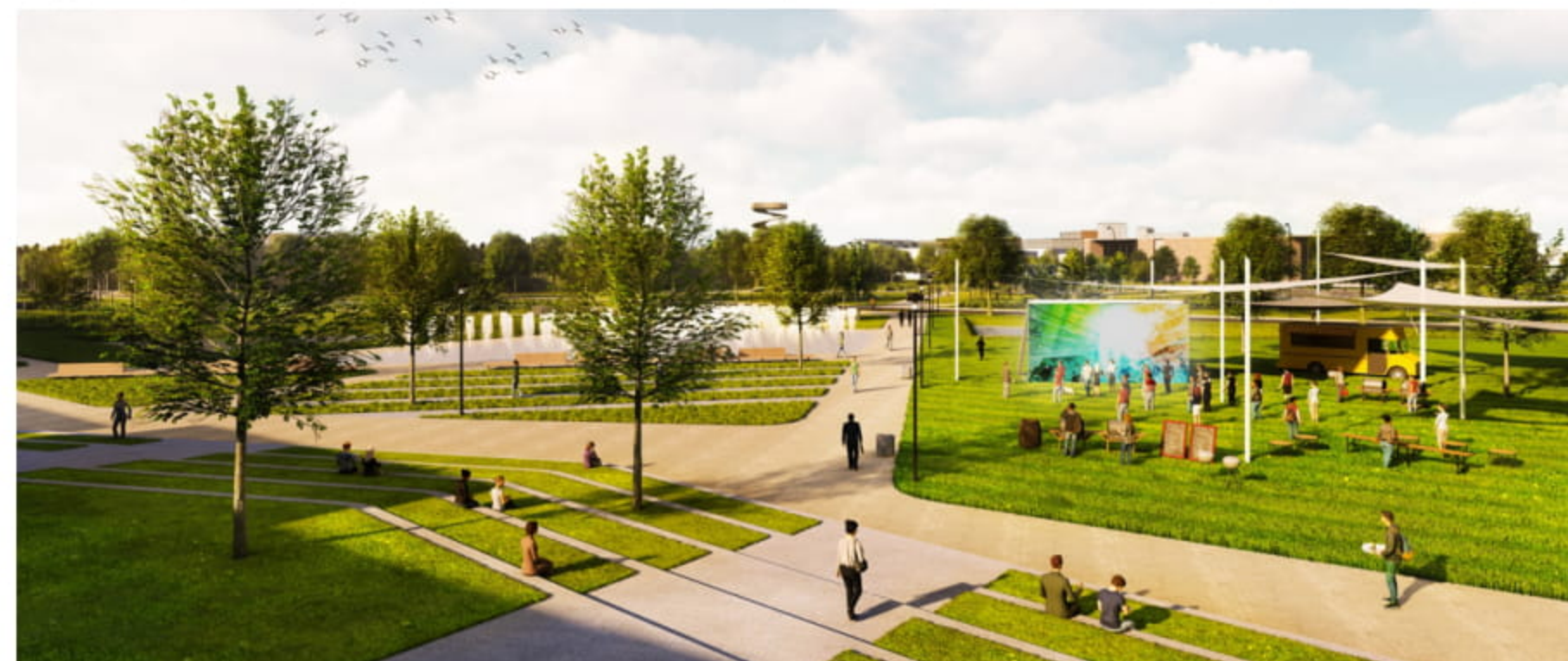
De grote parking wordt omgevormd tot een groene open ruimte.