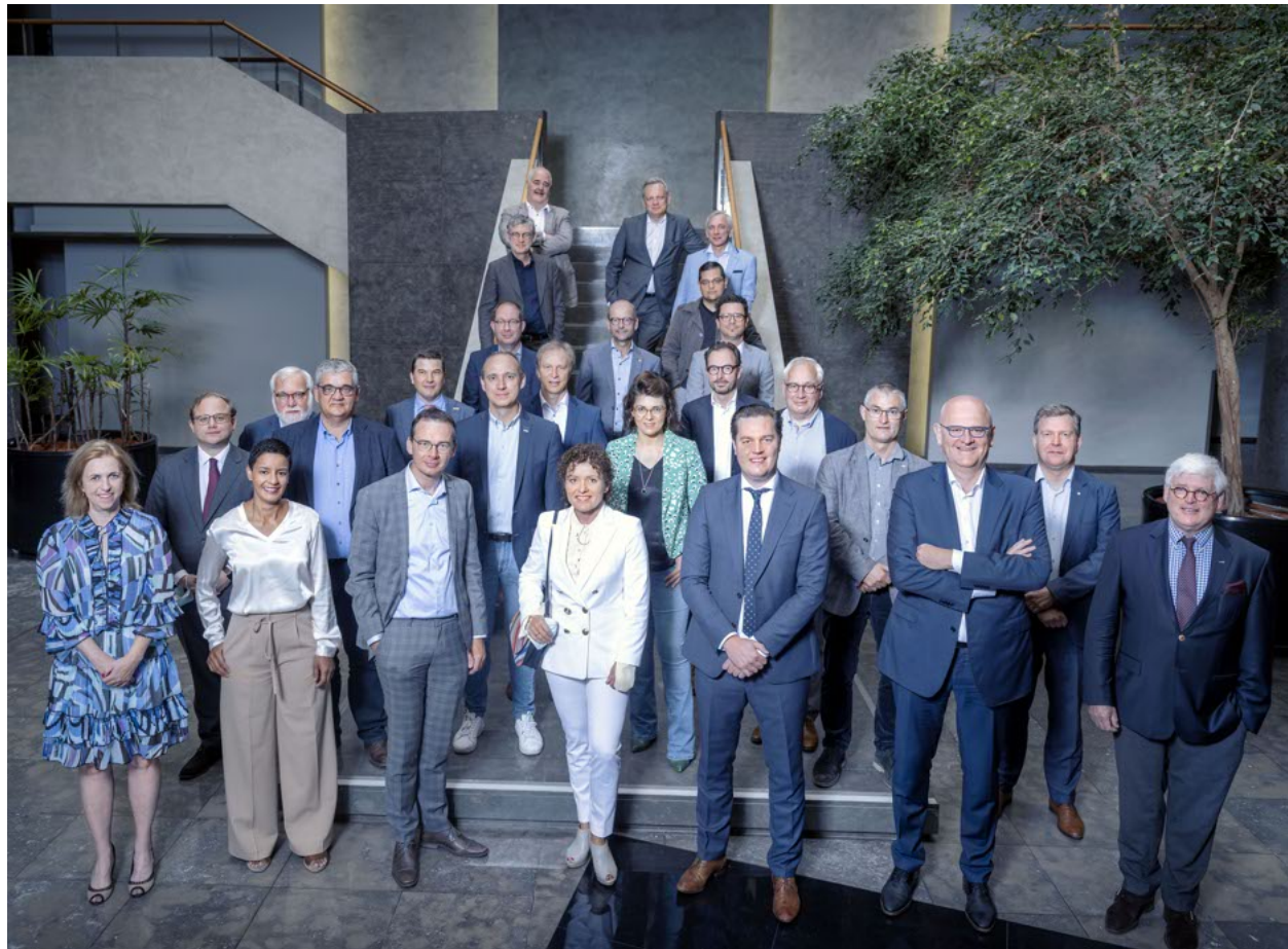
Op basis van een screening heeft de taskforce 18 SALKturbo-projecten erkend.

Door de erkenning als Europese transitieregio vloeit de komende zes jaar 152 miljoen euro naar onze provincie. "We gaan de 18 goedgekeurde projecten nu tot een sterk projectdossier uitwerken zodat ze naast provinciale, Vlaamse en federale subsidies ook aanspraak kunnen maken op 50 procent cofinanciering door Europa", zegt Vandeput. "SALKturbo sluit immers perfect aan op de Europese, federale en Vlaamse relanceplannen. Want wat goed is voor Limburg, is ook goed voor Vlaanderen, België en Europa." De taskforce heeft gisteren ook een tweede oproep voor projectaanmeldingen gelanceerd. Die loopt tot 30 oktober.