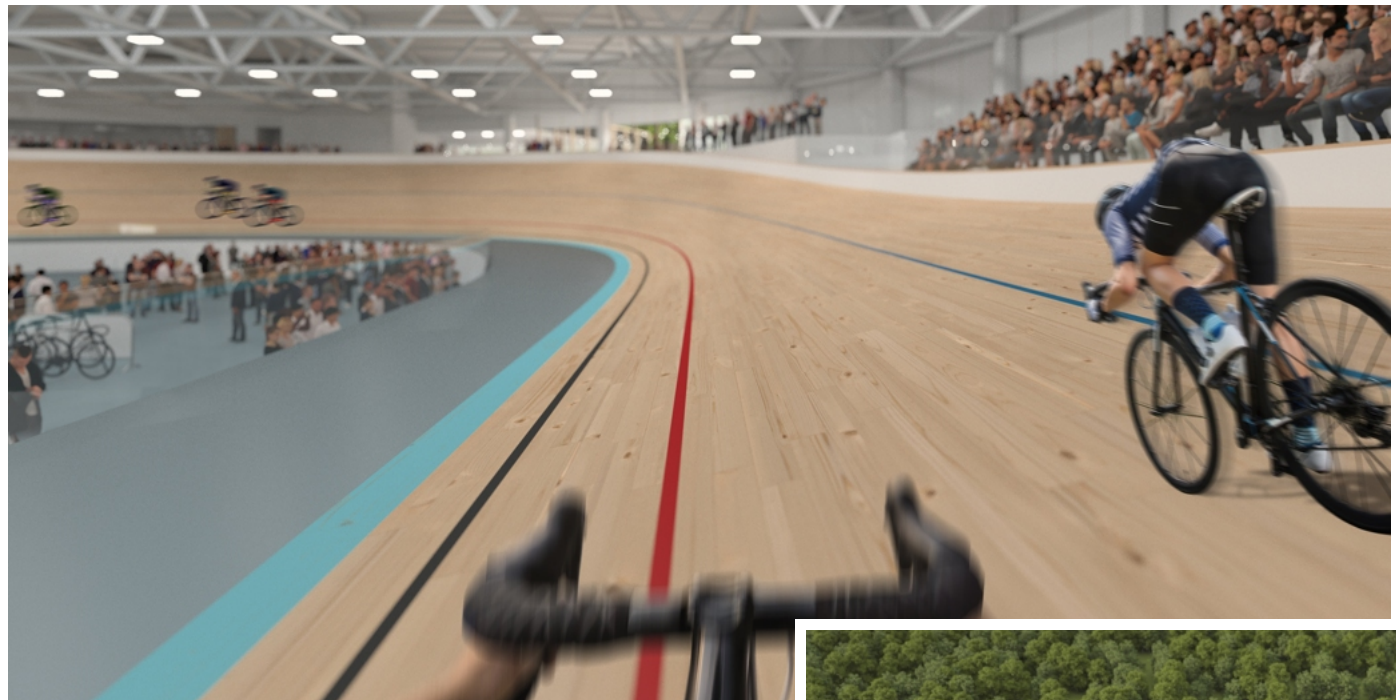
De wielerpiste krijgt brede bochten, zodat er recordtijden kunnen worden neergezet.

De vorm van de piste zal van Zolder de snelste baan van ons land en de wijde omgeving maken. Volgens het architectenbureau dat het ontwerp deed, is gekozen voor brede bochten, in plaats van korte bochten zoals in Gent of Roubaix. En dat allemaal om nieuwe records te kunnen neerzetten. "Vanaf 2025 zullen we in Zolder kandidaat zijn om het WK Baanwielrennen te organiseren", glun-