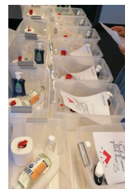
Voor elke werknemer is er een survivalkit.

Autogloss Clinic, met vestigingen in onder meer Hasselt en Bree, start maandag zijn activiteiten voor bedrijven die klant zijn. Volgende week zijn ze weer open voor particulieren. "We hebben drie ingangen: de hoofdingang voor de klanten, een andere ingang voor de bedienden en de monteurs komen binnen via de garage. We hebben in principe voldoende plaats om de social distancing te waarborgen. Bedienden werken nog zo veel mogelijk thuis. Al hebben ze hun eigen kantoor, waar ze ongestoord en zonder contact kunnen werken. De monteurs hebben in de montagehal genoeg ruimte. Ze werken elk aan hun wagen. Enkel bij het uitsnijden of inleggen van een ruit wordt de anderhalve meter overschreden. Daarom voorzien we ook mondkapjes. We hebben een survivalkit voor elke medewerker, met handgel, handzeep en een rol we-papier. Dat we-papier zit er voor de lol bij, omdat dit nu het meest luxe cadeau is wat je kan geven (lacht). De meeste werknemers zijn blij dat ze terug mogen komen werken. Al is het ook wat dubbel: collega's mogen ze terugzien, maar hun familie nog niet." 1 hd