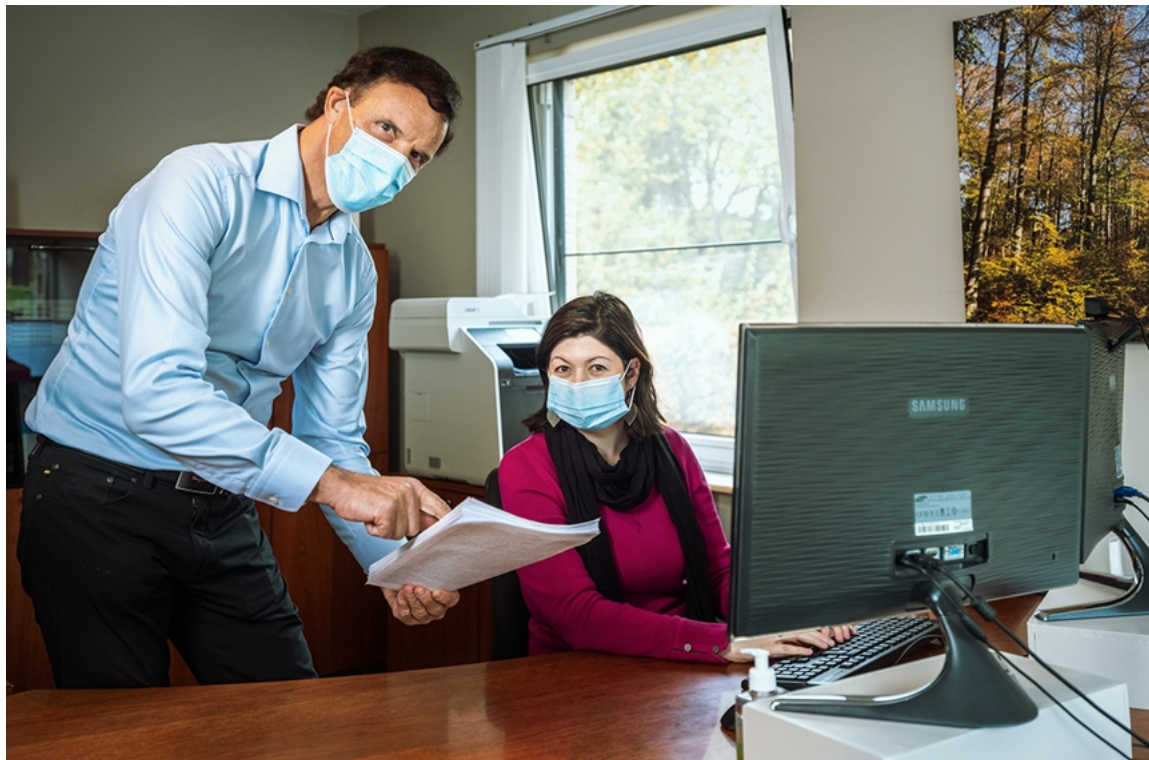
Limburgse bedrijven zijn overtuigd van het nut en de effectiviteit van opleidingen.

reau een nieuwe overschrijding in november. Dan zouden de uitkeringen in december en de ambtenarenwedges in januari 2022 met 2 procent stijgen. Het Planbureau denkt nu dat de inflatie dit jaar op 1,3 procent zal uitkomen, en op 1,6 procent volgend jaar..