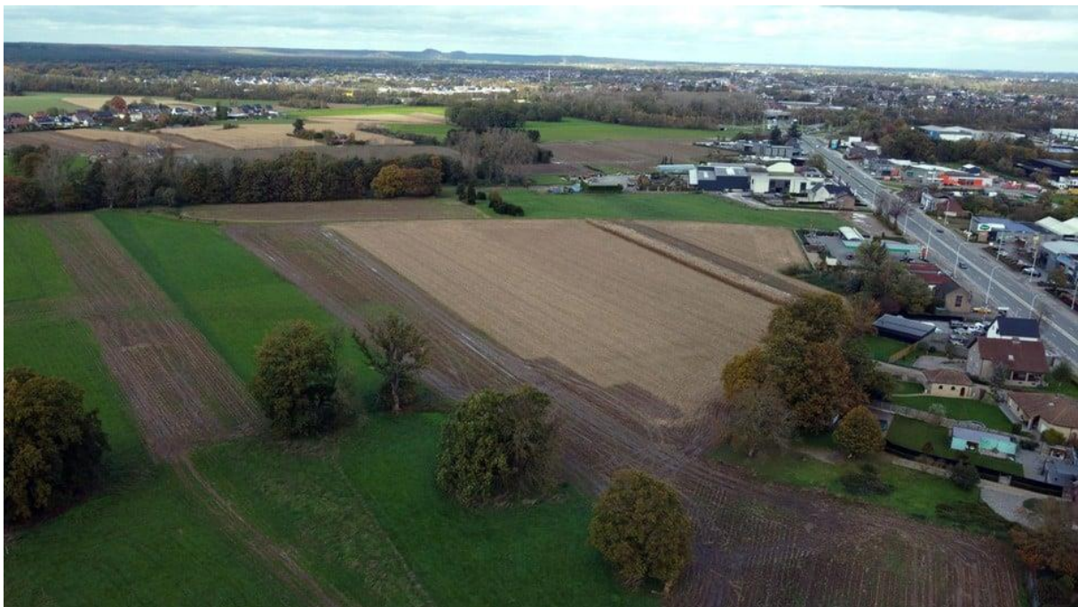
Nieuwe Bunders ligt tussen Opgrimbie, de E314 en de Rijksweg aan de overzijde van bedrijventerrein Oude Bunders.