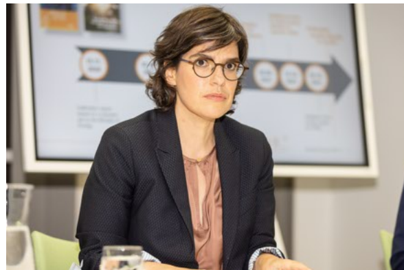
Minister van Energie Tinne Van der Straeten.

Van der Straeten blijft vooralsnog hopen op Vilvoorde. "De eerste