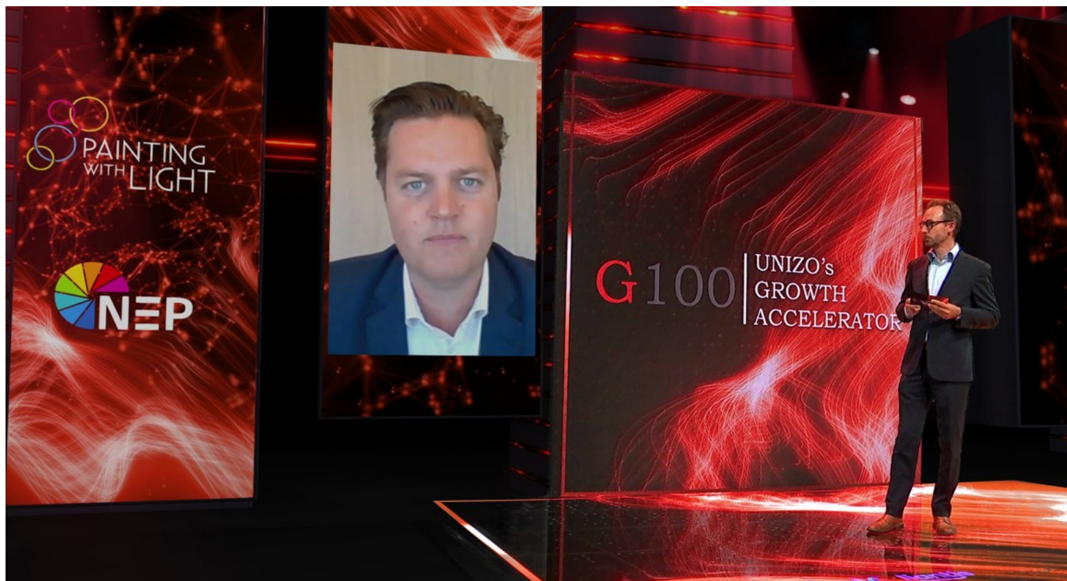
Tijdens het G100-evenement van Unizo Limburg werd gedeputeerde Tom Vandeput 'virtueel', maar haarscherp op het podium geroepen.

De Genkse licht- en multimedia-expert Painting with Light heeft van de coronanood een deugd gemaakt. Als eerste in België heeft het bedrijf een studio geïnstalleerd die een interactief virtueel evenement mogelijk maakt. In hoge beeldkwaliteit.