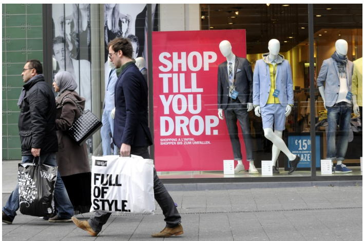
Bedrijven mogen vanaf 4 mei weer opstarten, de winkels daarentegen moeten nog een weekje langer dichtblijven en mogen pas op 11 mei weer de deuren openen.

De werkgevers toonden zich vrijdagavond alvast tevreden over een definitieve datum voor de heropstart van de economie, mits inachtnaam van de nodige gezondheidsmaatregelen. De vakbonden waarschuwen wel: zij willen geen risico's voor de gezondheid van de werknemers.