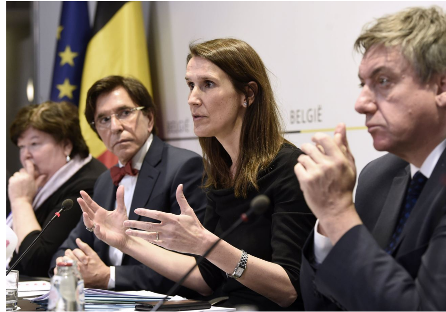
Premier Sophie Wilmès en de minister-presidenten van de deelstaten gaven vrijdagavond een gedetailleerd overzicht van de verschillen van de Belgische exitplan.

kunnen spelen in het maken van mondmaskers.