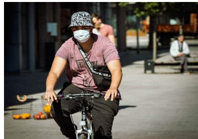
Eens er duidelijkheid is, dringen de meeste Limburgse burgemeesters aan op een gezamenlijke aankoop.