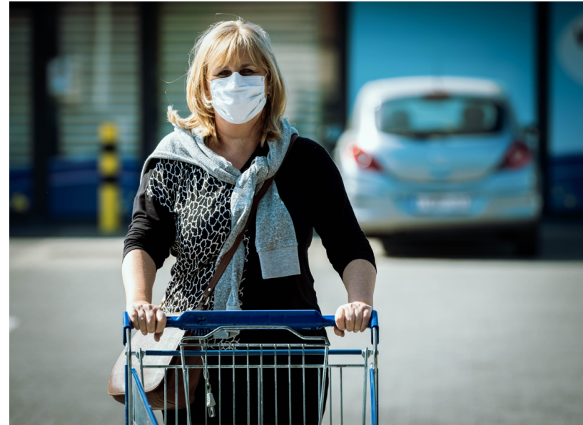
Experten lijken het erover eens dat het dragen van mondklappers een belangrijke rol kan spelen bij de afbouw van de coronamaatregelen. Maar er zijn nog een heleboel vragen over het type masker, wanneer verplicht of niet, de verdeling, aankoop en financiering.

is volgens ons niet goed dat elke stad of gemeente hieromtrent een eigen apart beleid voert", besluit Lis-mont.